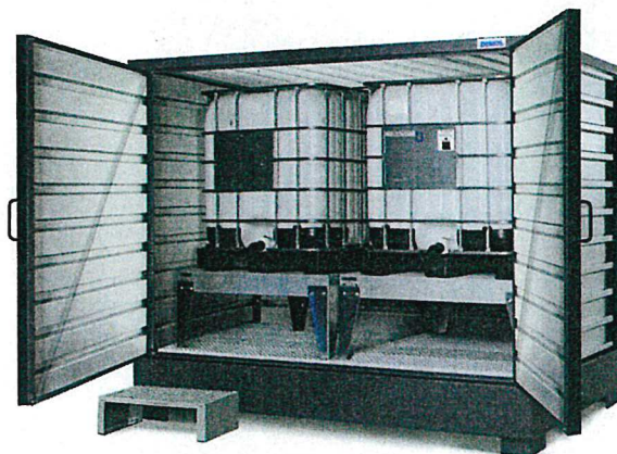
Mit dem 1-stufigen Tritt können Sie komfortabel den oberen Teil eines Gebindes erreichen, um z. B. eine Fasspumpe zu bedienen.