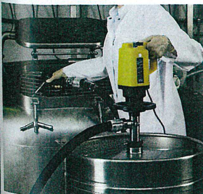
Fasspumpe zur Förderung von entzündbaren Flüssigkeiten.