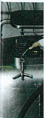
Fasspumpe zur Förder

Wenn Sie sich für komfortableren Tritt in den Anforderungen im gemeinsamen mit Ihrer finden Sie auf unse