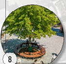
8 Neue Mitte Multifunktionsflächen, Außengastro, Gartenanlagen