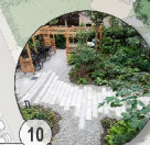
10 Neue Mitte Multifunktionsflächen, Außengastro, Gartenanlagen