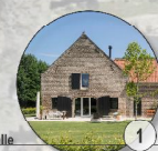
Sanierte Hofstelle Div. Nutzungen