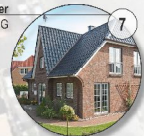
Einfamilienhäuser "klassisch", I+DG