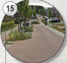
15 Wohnstraße Shared-Space