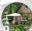
9 Neue Mitte Multifunktionsflächen, Außengastro, Gartenanlagen