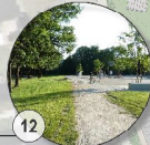
12 Neue Mitte Multifunktionsflächen, Außengastro, Gartenanlagen