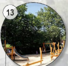
13 Grüner Anger Parkanlage, Außenhall, Erlebnis