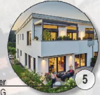
Reihenhäuser altersgerecht, I+DG