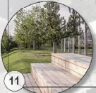
11 Neue Mitte Multifunktionsflächen, Außengastro, Gartenanlagen