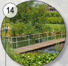
14 Erlebbar Wasserwirtschaft Regenrückhaltung, Parkanlage